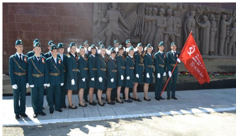
Юнармейский пост №1 у мемориала «Тыл - фронту» г. Пермь

Опыт работы юнармейского объединения «Пост №1» г. Перми был